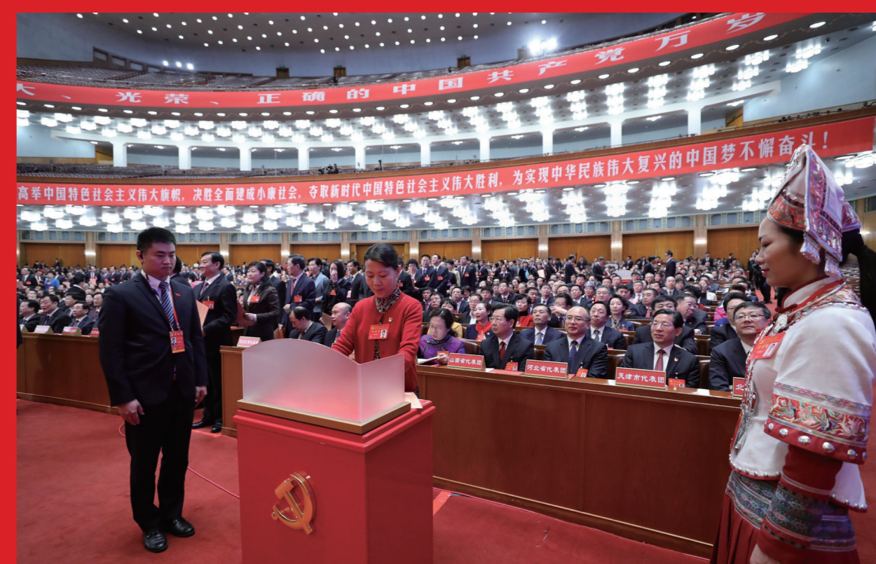
2017年10月24日，中国共产党第十九次全国代表大会代表投票选举中央委员会委员、候补委员和中央纪律检查委员会委员。