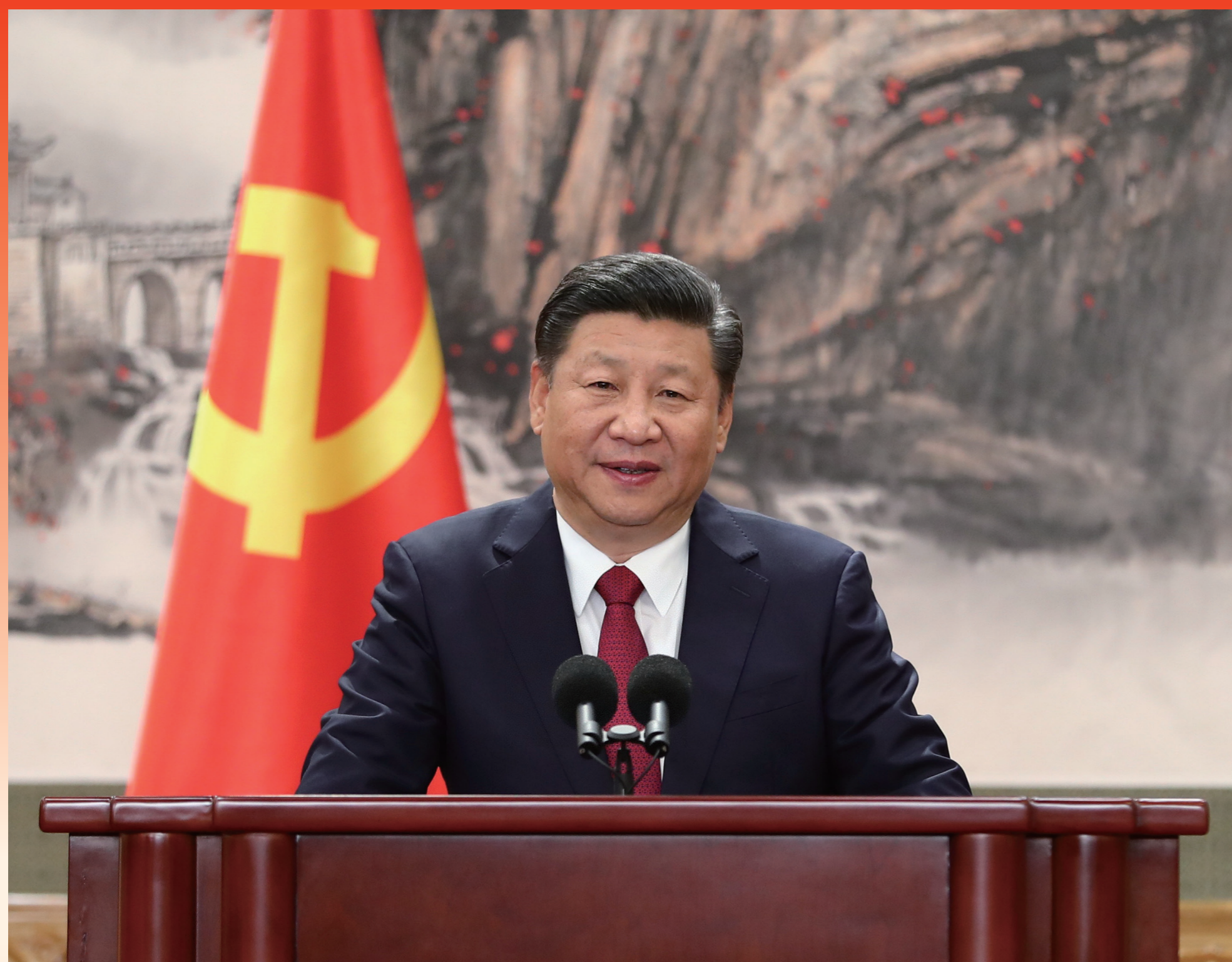
2017年10月25日，在中共十九届一中全会上当选的中共中央总书记习近平同采访十九大的中外记者见面时发表重要讲话。

从全面建成小康社会到基本实现现代化，再到全面建成社会主义现代化强国，是新时代中国特色社会主义发展的战略安排。我们要坚忍不拔、锲而不舍，奋力谱写社会主义现代化新征程的壮丽篇章。