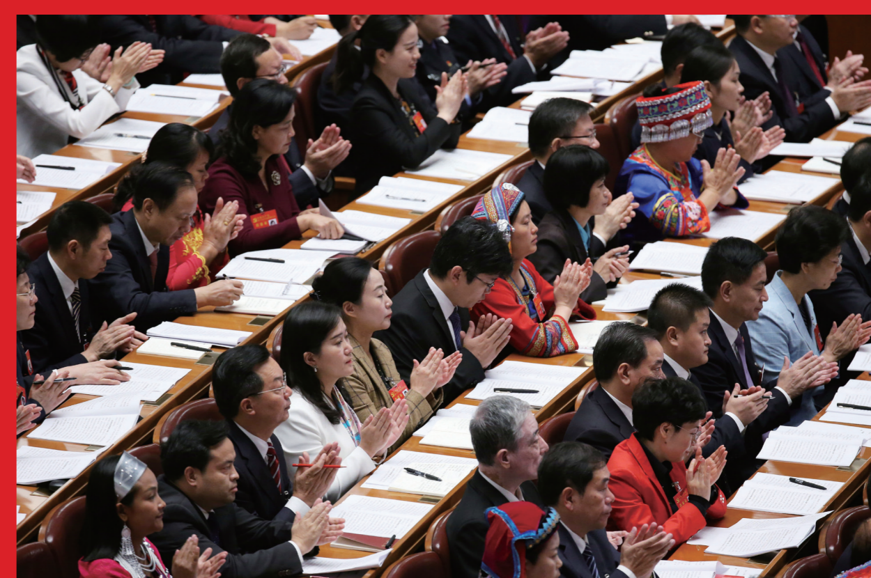
2017年10月18日，代表在中国共产党第十九次全国代表大会上听取报告。