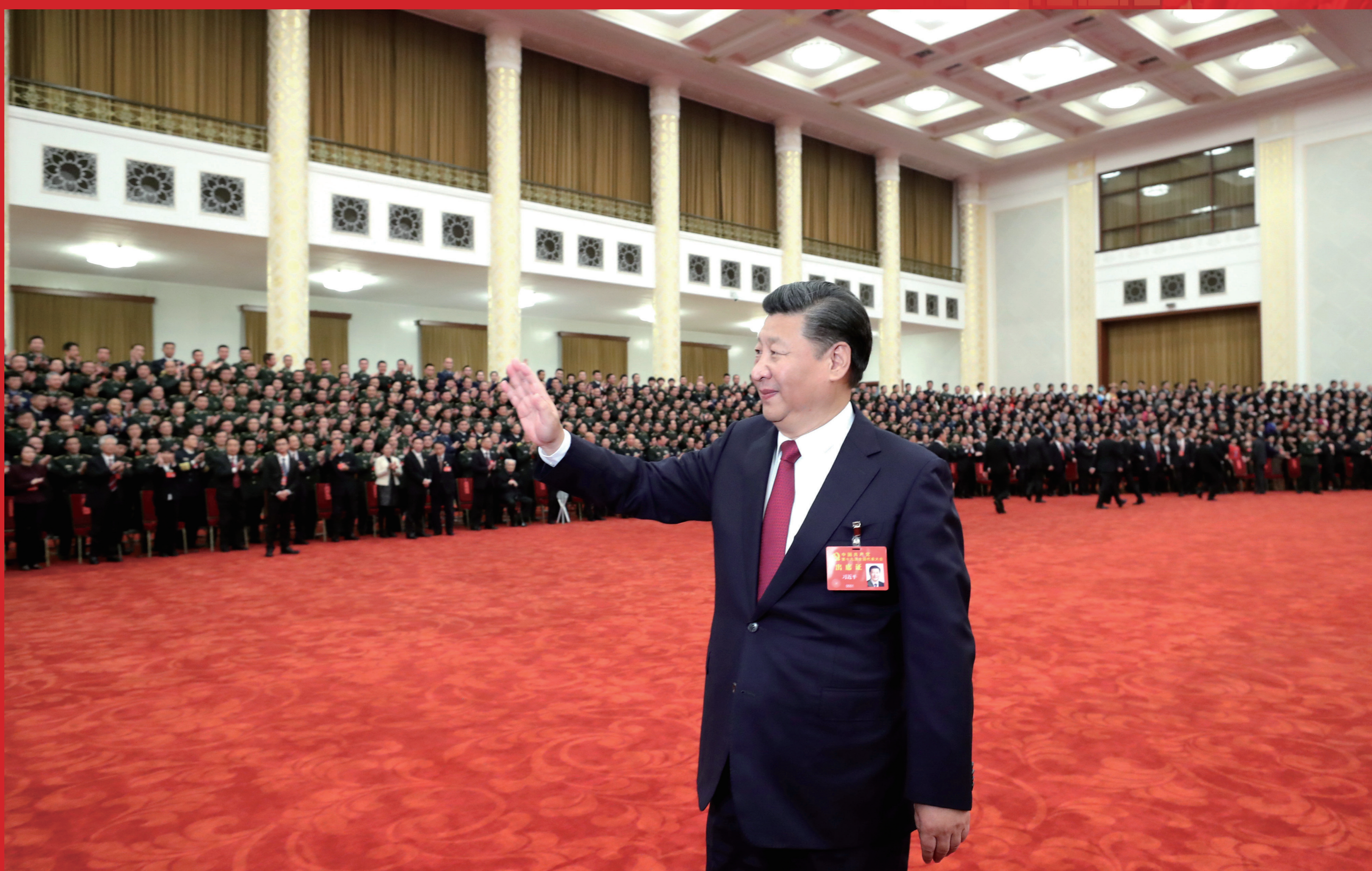
2017年10月25日，中共中央总书记、国家主席、中央军委主席习近平等领导同志在北京人民大会堂亲切会见出席党的十九大代表、特邀代表和列席人员。