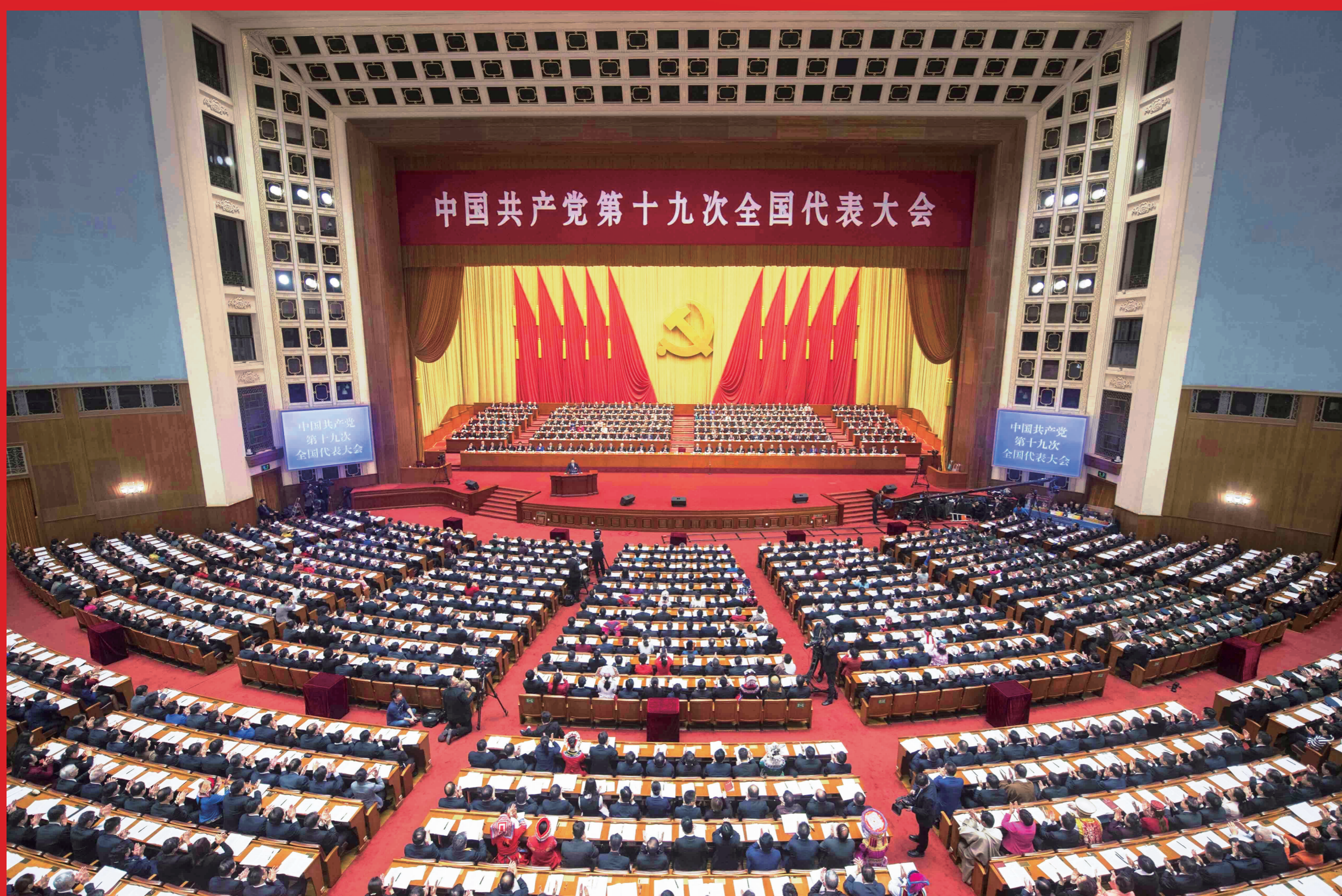
2017年10月18日，中国共产党第十九次全国代表大会在北京人民大会堂隆重开幕。

大会主题：不忘初心，牢记使命，高举中国特色社会主义伟大旗帜，决胜全面建成小康社会，夺取新时代中国特色社会主义伟大胜利，为实现中华民族伟大复兴的中国梦不懈奋斗。