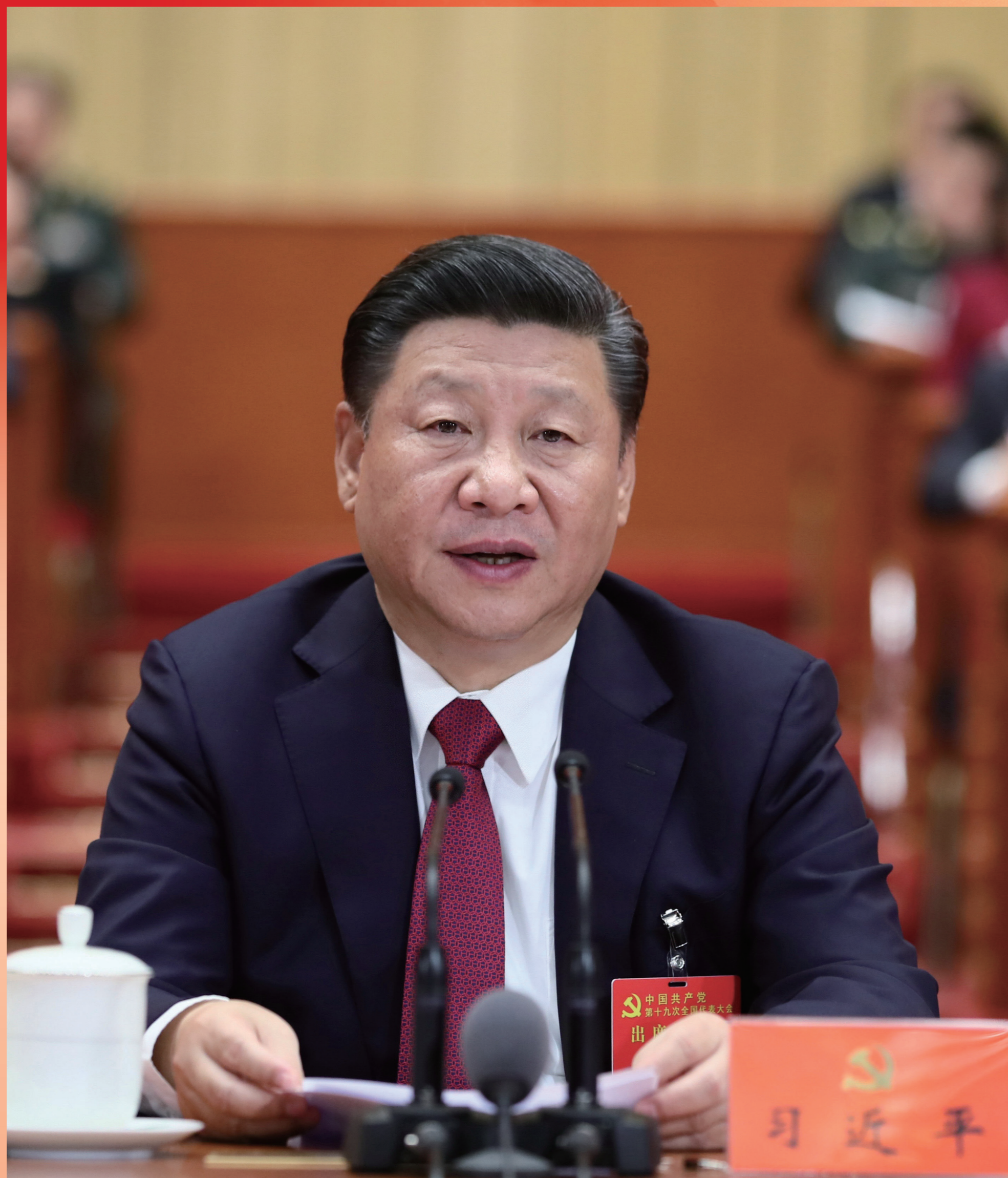
2017年10月24日，中国共产党第十九次全国代表大会在北京人民大会堂胜利闭幕。习近平同志主持大会。