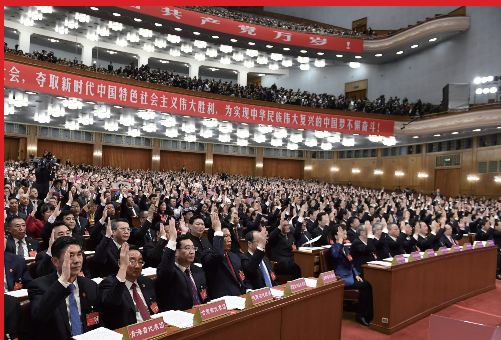
代表在会上举手表决。