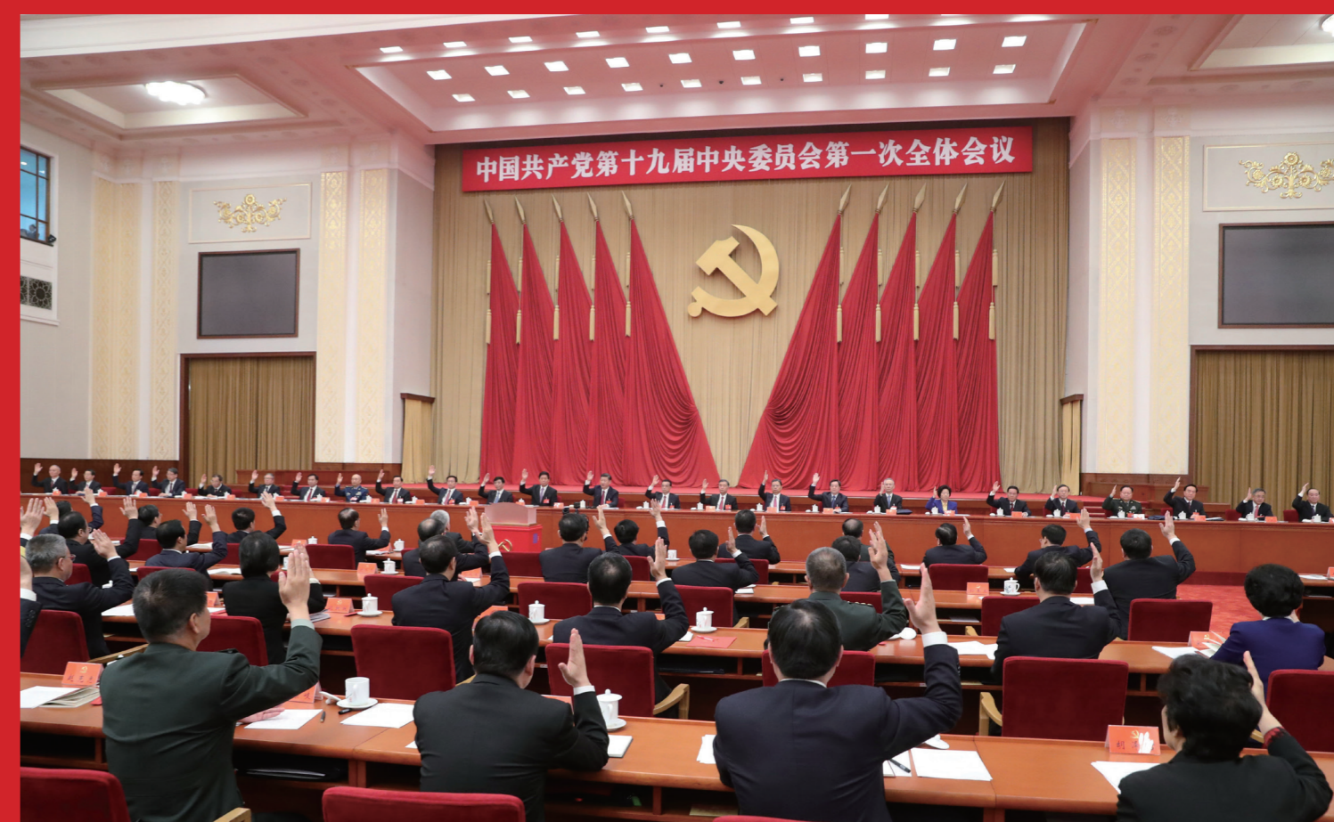
2017年10月25日，中国共产党第十九届中央委员会第一次全体会议在北京人民大会堂举行。