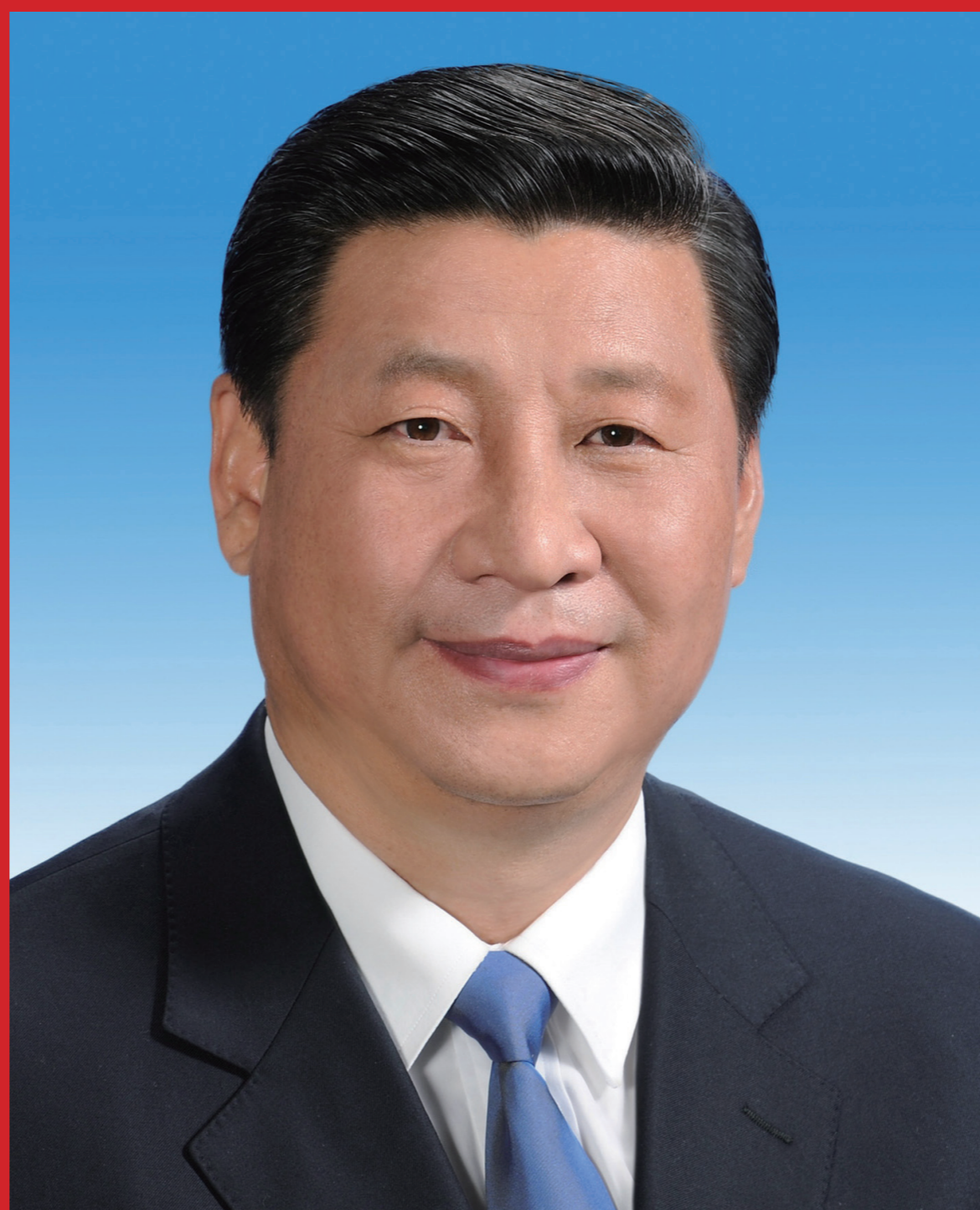
中共中央委员会总书记、中央军事委员会主席习近平

“中国特色社会主义进入了新时代”，这是党的十九大对我国发展新的历史方位的科学判断，也是贯穿党的十九大报告的一条主线。在新时代坚持和发展中国特色社会主义，就要深刻认识新时代的重大意义和丰富内涵，就要深刻认识新时代我国社会主要矛盾的历史性变化，从而牢牢把握我们党在新时代的历史使命，更好进行伟大斗争、建设伟大工程、推进伟大事业、实现伟大梦想，在新时代中国特色社会主义的伟大实践中，以党的坚强领导和顽强奋斗，激励全体中华儿女不断奋进，凝聚起同心共筑中国梦的磅礴力量。