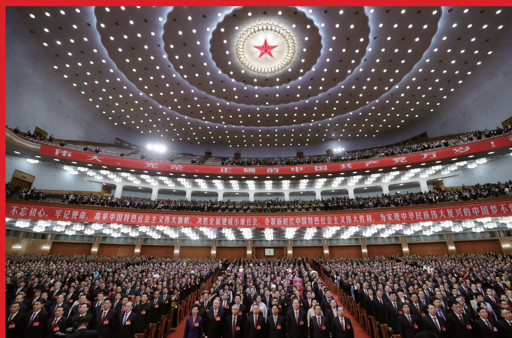
2017年10月24日，中国共产党第十九次全国代表大会闭幕会在北京人民大会堂举行。图为全体起立，奏《国际歌》。