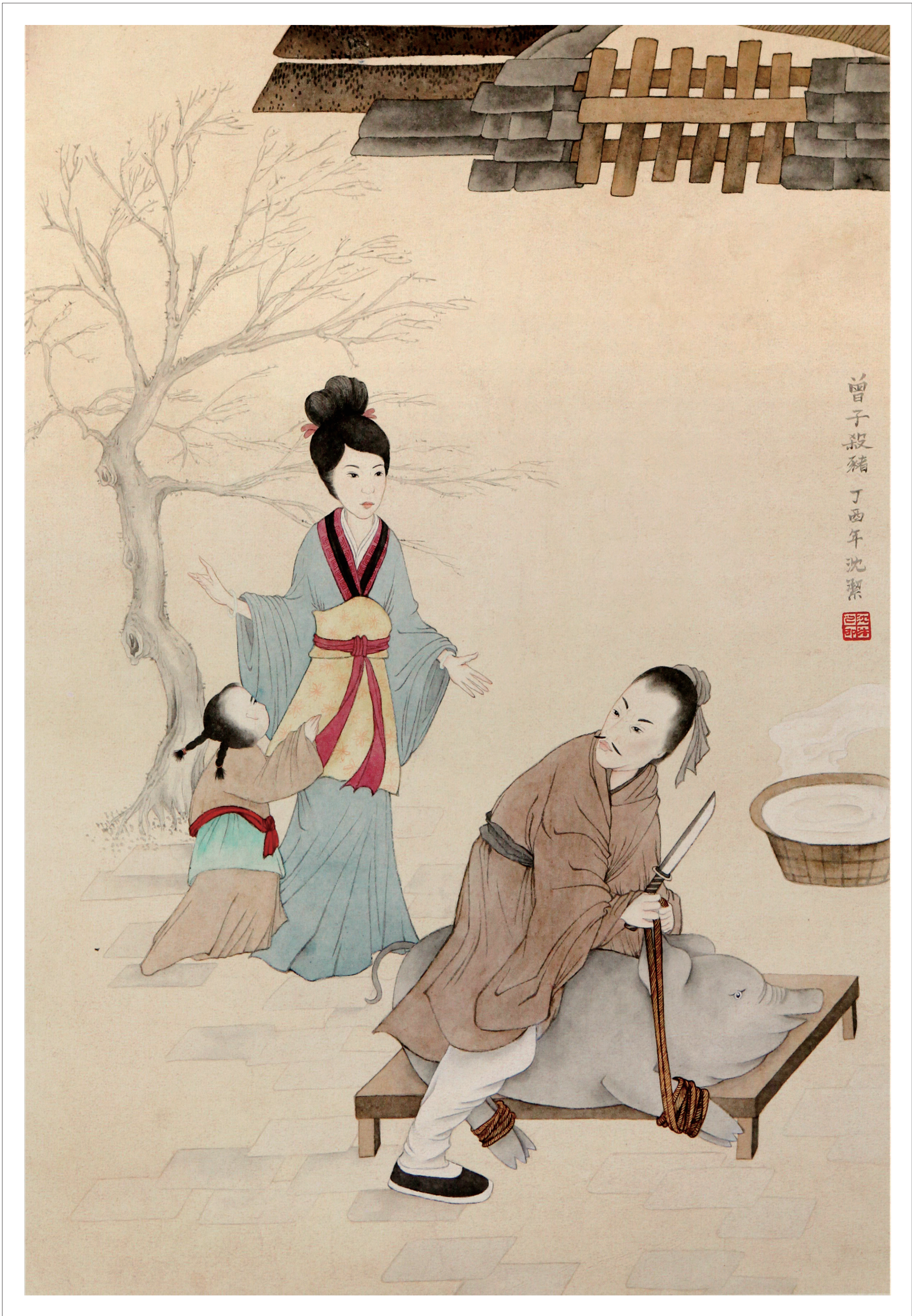
《曾子杀猪》 沈洁 作