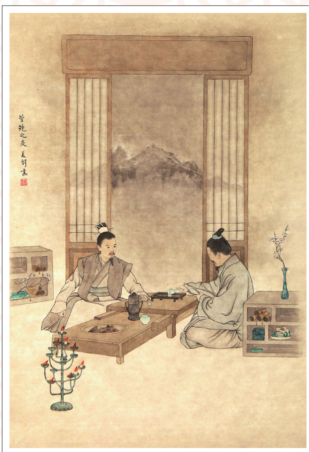
《管鲍之交》 林美舒 作