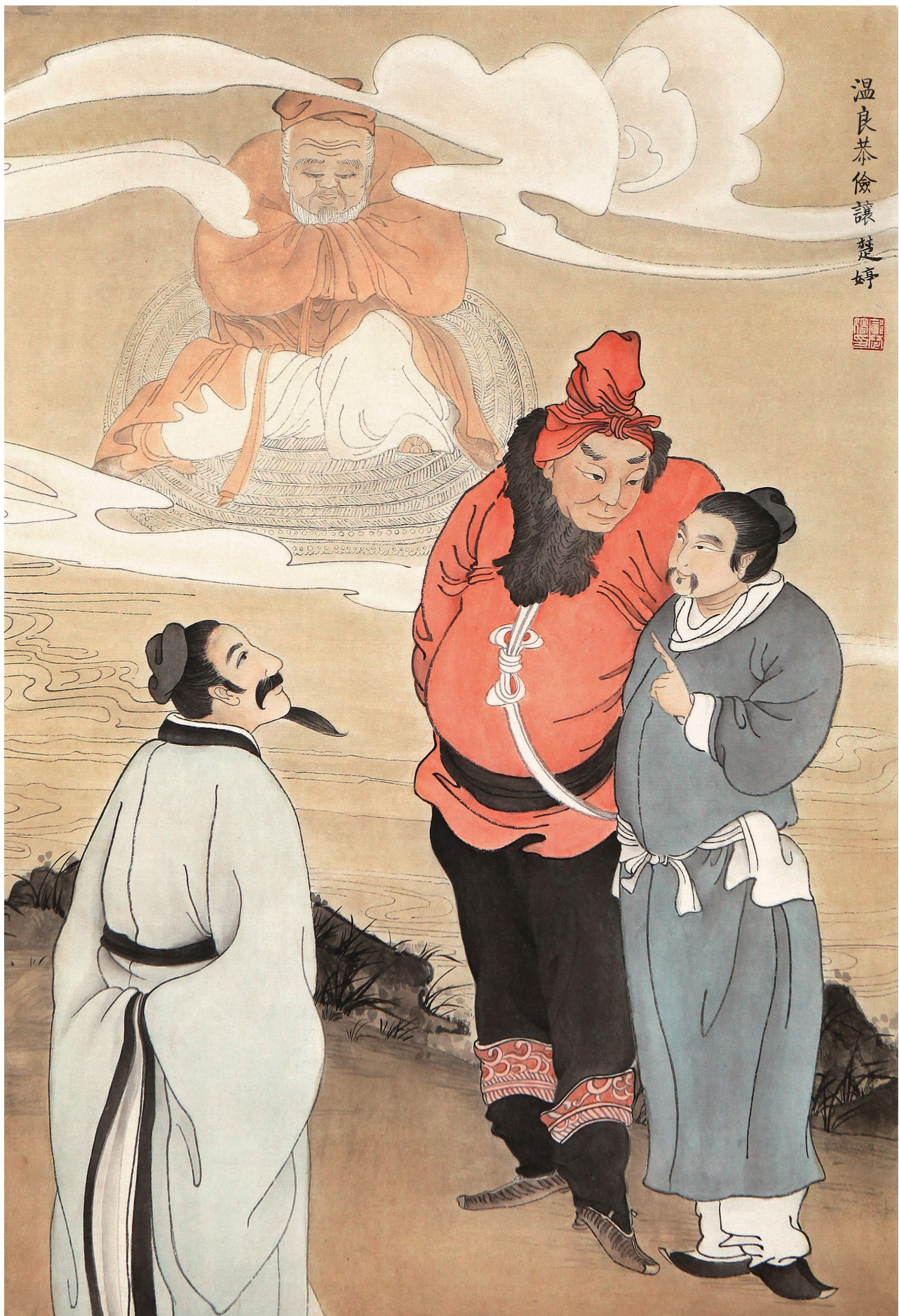
《温良恭俭让》 邝楚婷 作