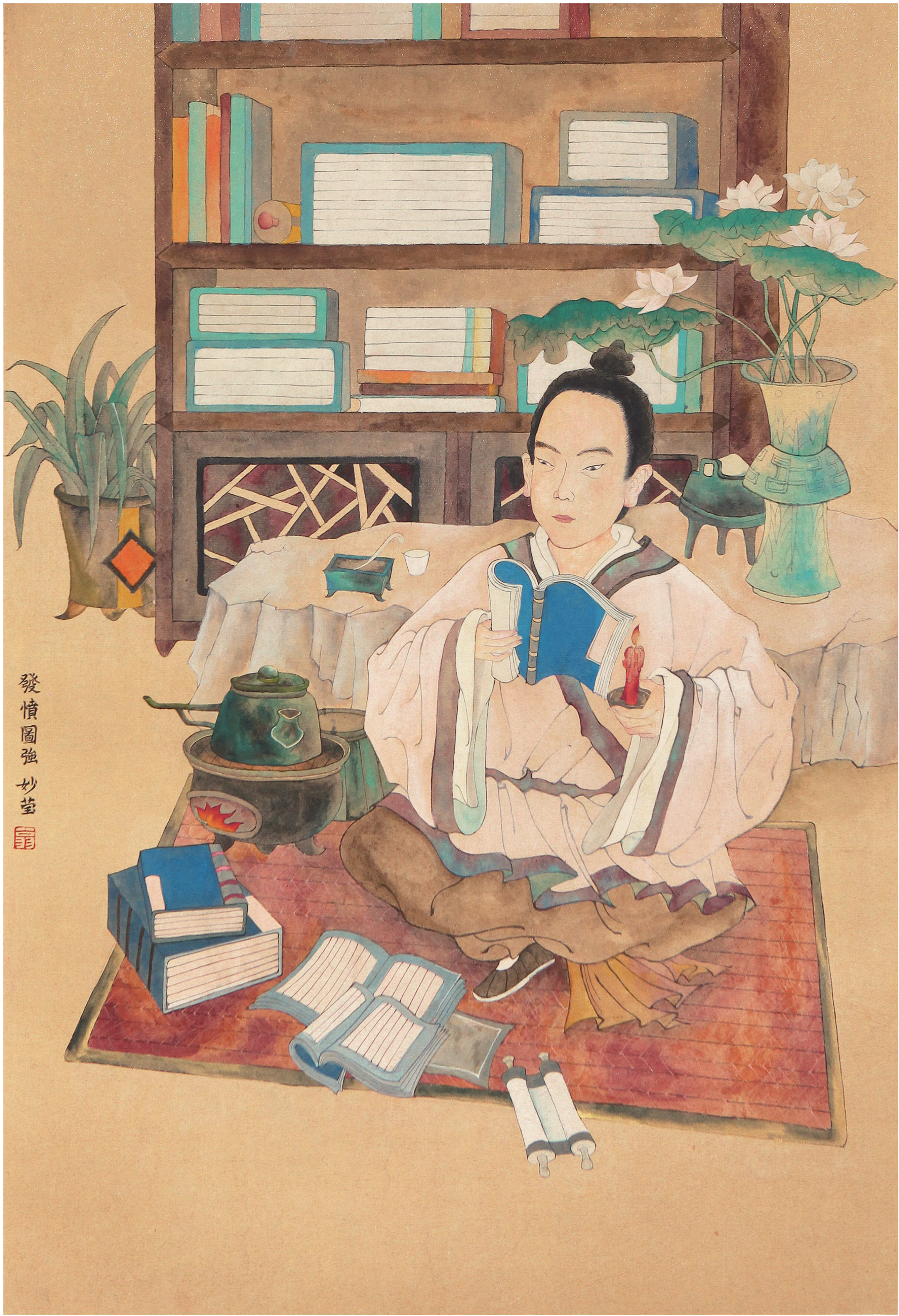
《发愤图强》 翁妙莹 作