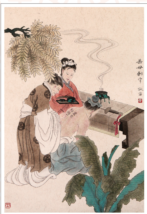
《岳母刺字》 黄咏茵 作