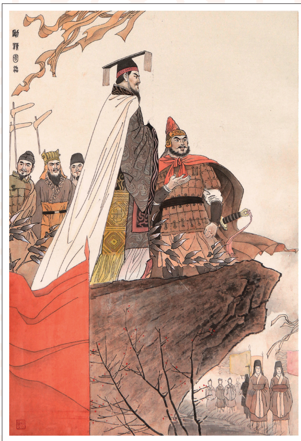
《励精图治》 陈挺通 作