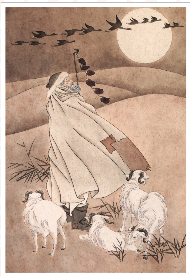
《苏武牧羊》 黄咏茵 作