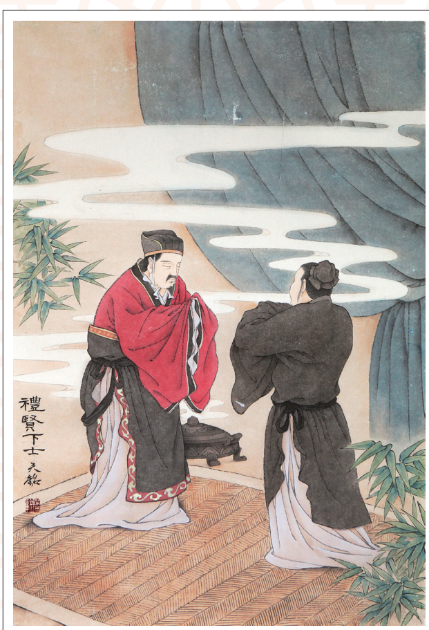
《礼贤下士》 梁天铭 作