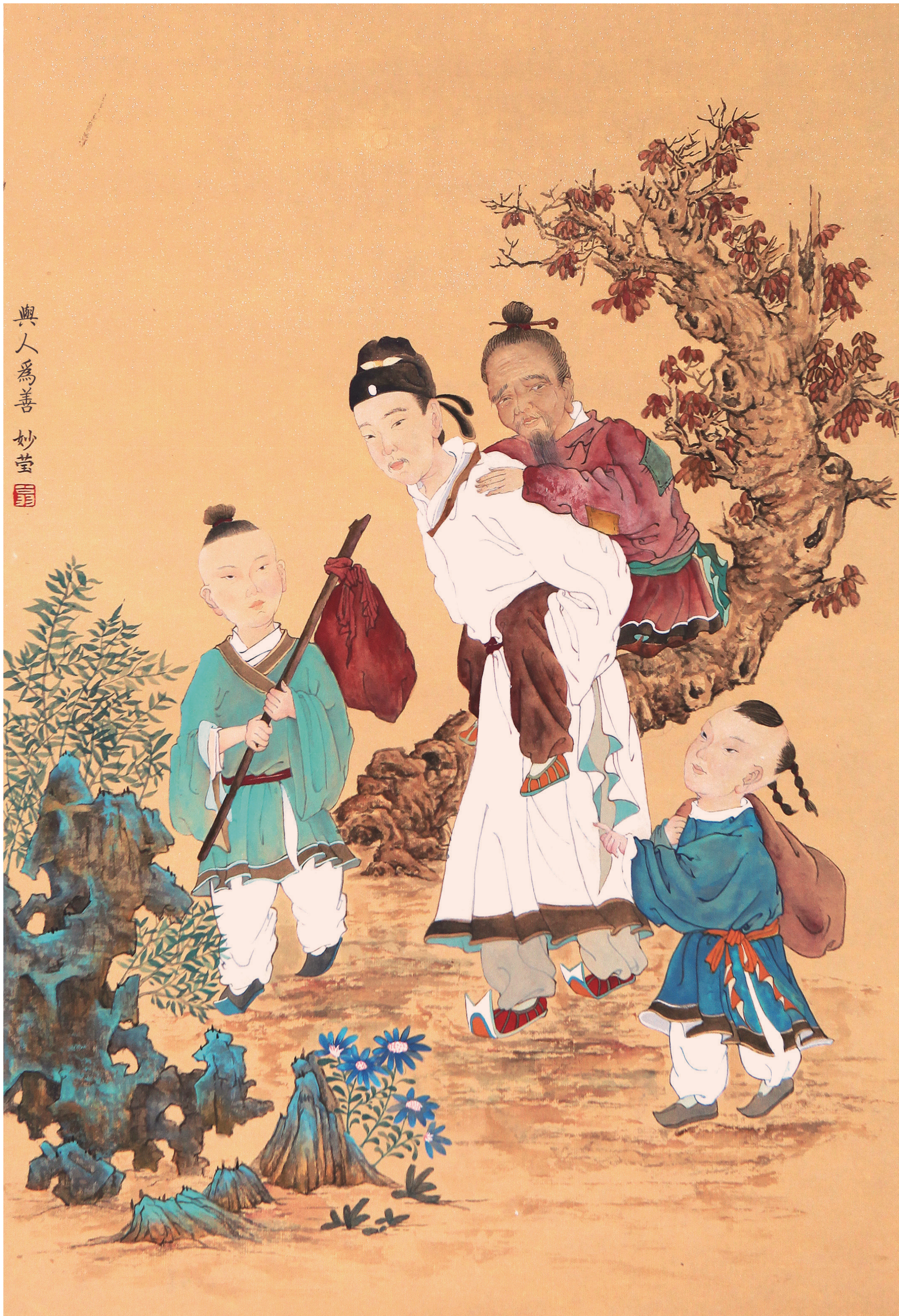
《与人为善》 翁妙莹 作