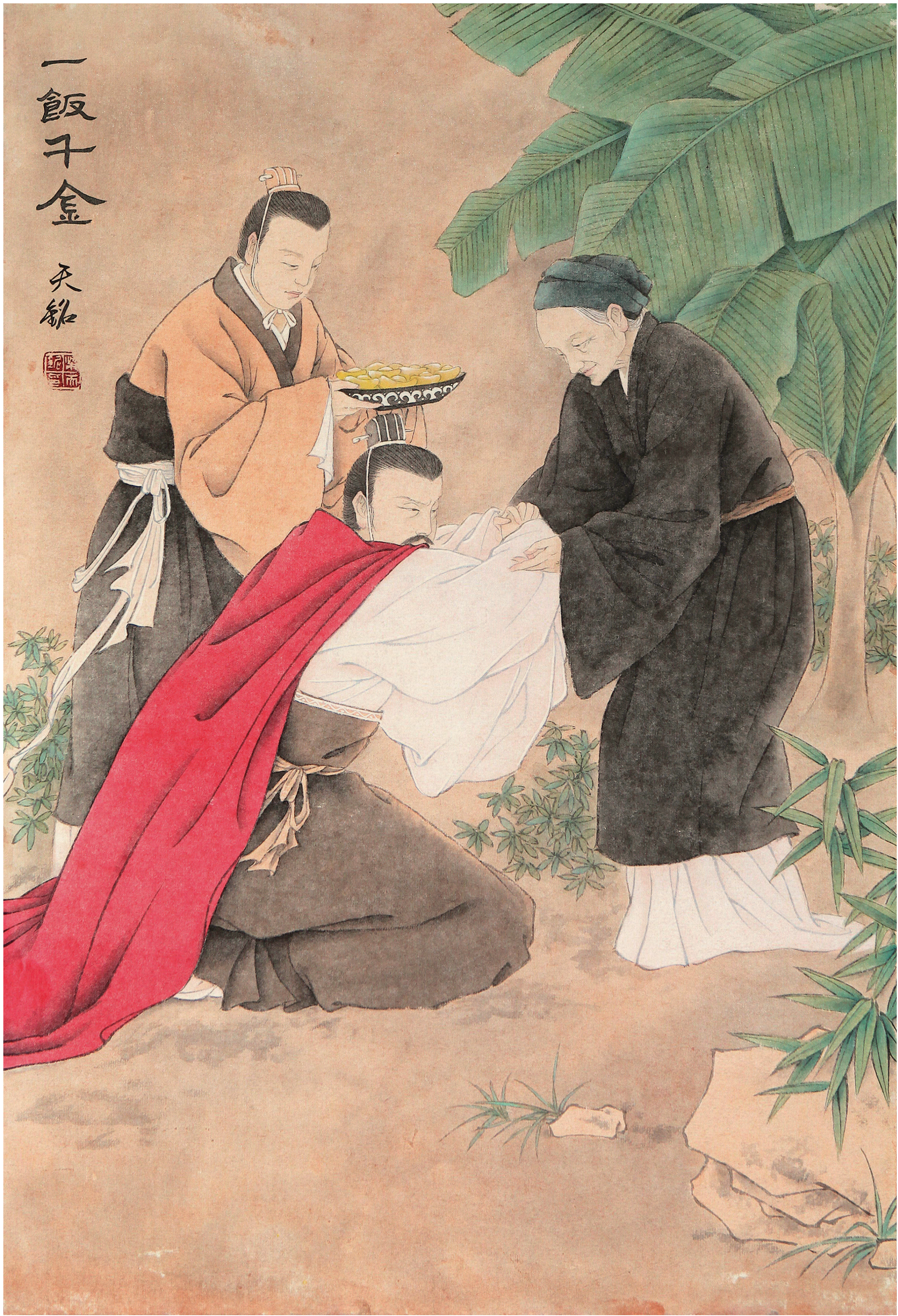
《一飯千金》 梁天銘 作