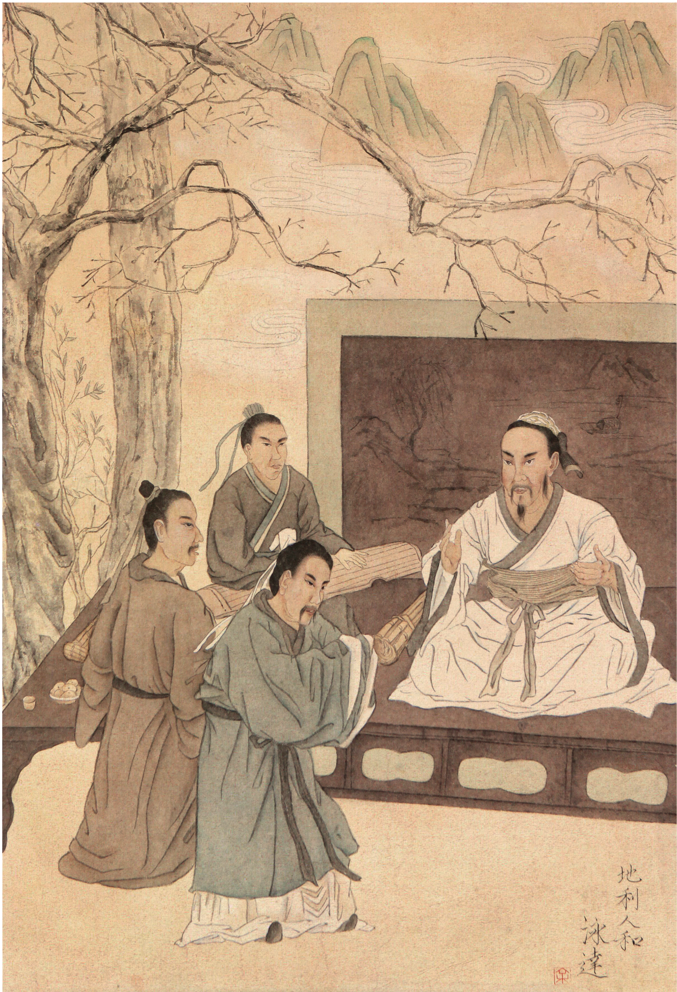
《地利人和》 余泳达 作