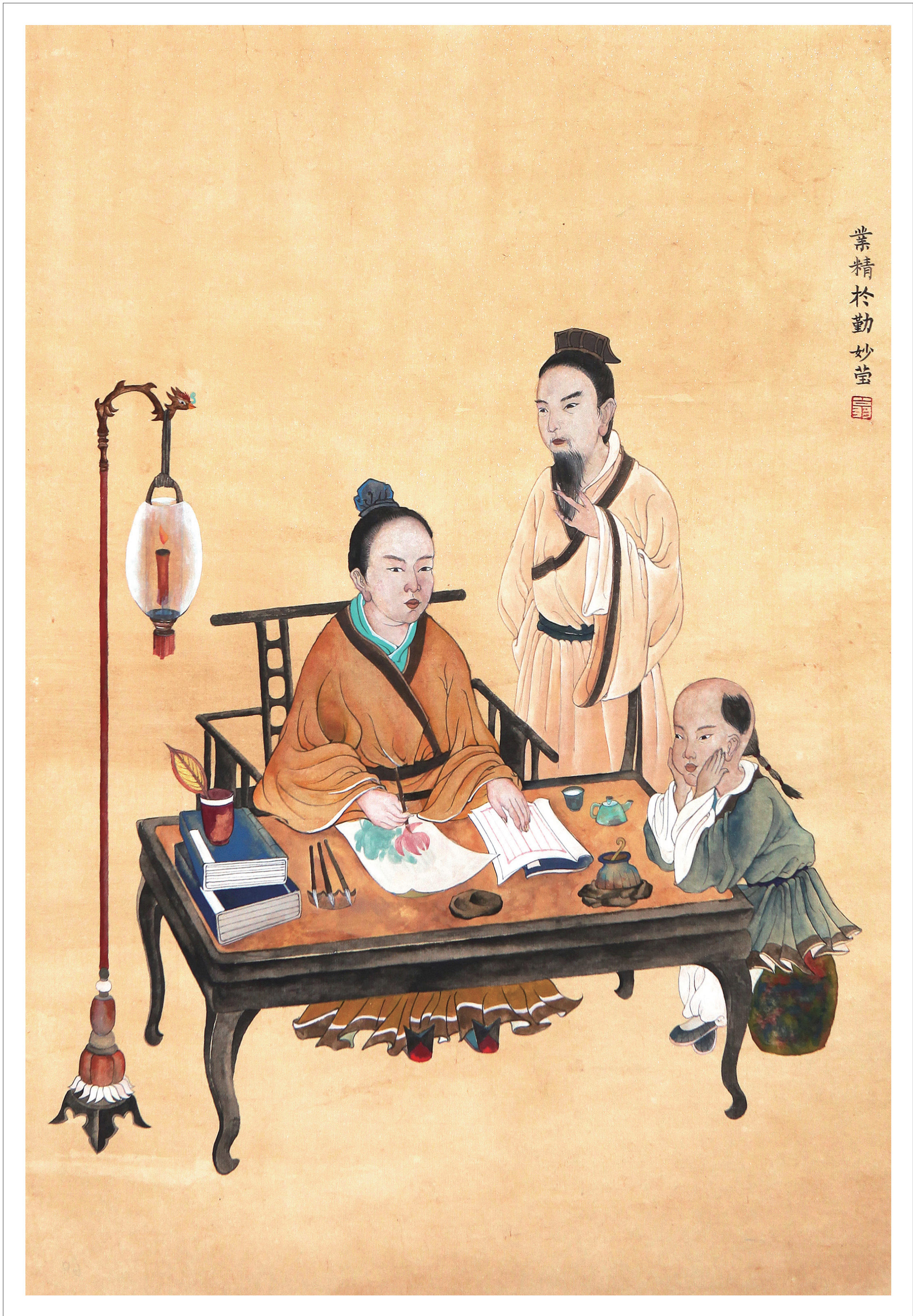
《业精于勤》 翁妙莹 作

韩愈是唐代著名的文学家，曾担任国子监博士。他在千古名篇《讲学解》中以国子先生的口吻教导学生：“学业的精深，取决于勤奋，游荡懈怠就会荒废；事业的成功，在于独立思考，随波逐流就要失败。”也就是“业精于勤，荒于嬉；行成于思，毁于随”。