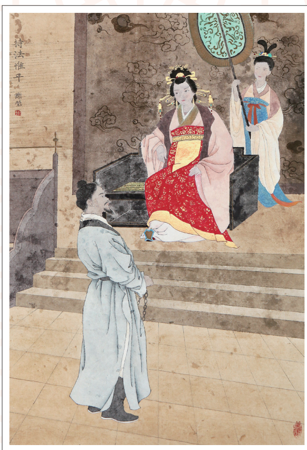
《持法惟平》 谢莹 作