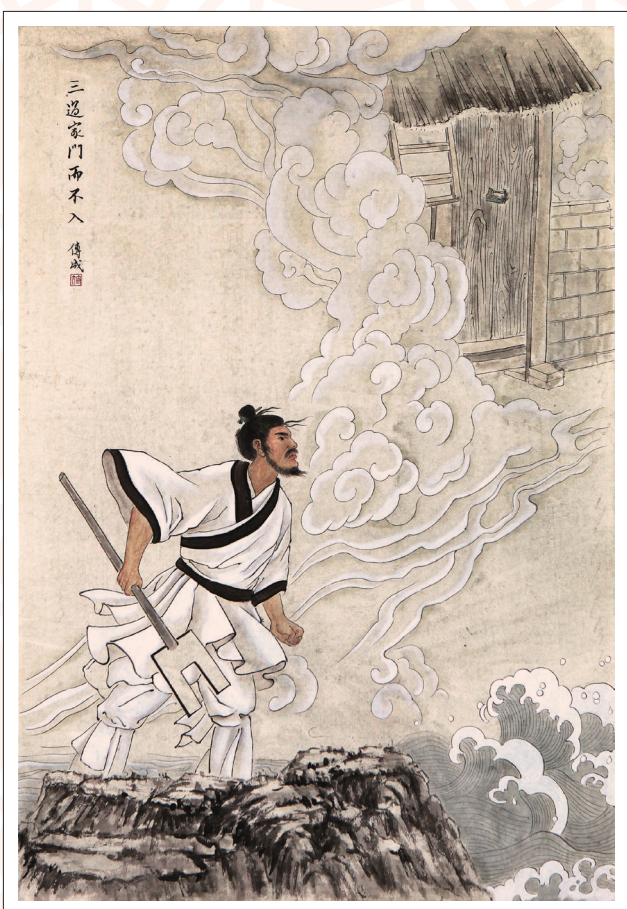
《三过家门而不入》 符传成 作