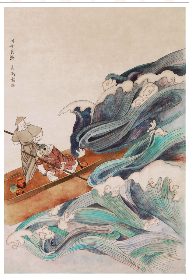
《同舟共济》 林美舒 作