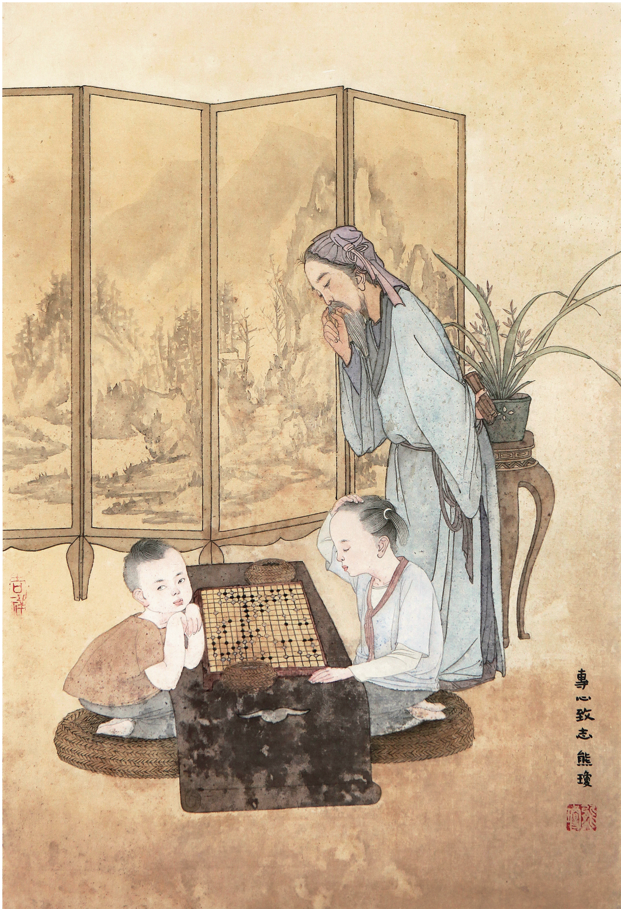
《专心致志》 熊琮 作

从前，有一个名叫秋的剑手，他有两个学生，一个非常专心地听老师讲解，另一个刚好相反。老师讲解的时候，不专心的学生眼睛好像在看棋子，其实心里却老觉得天上有大鸟要飞来，想着张弓搭箭去射它，结果老师的讲解一点也没听进去。所以这两个学生虽然一起拜师学习，但是那个专心致志的学生成了棋艺高强的名手，另一个却没有学到什么本事。