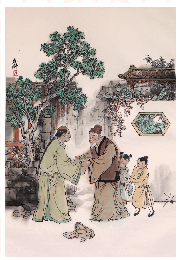
《六尺巷》 陈志瀚 作