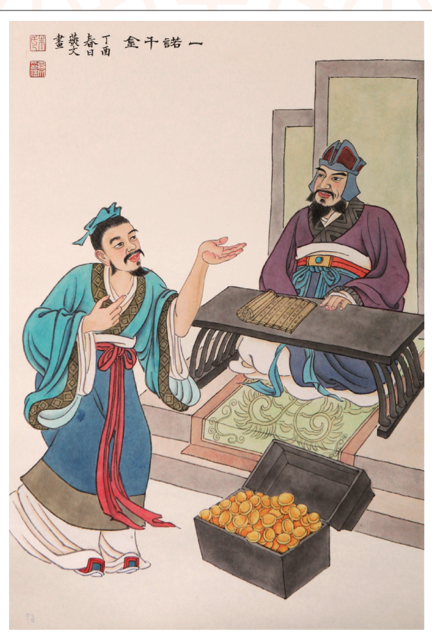
《一诺千金》 朱燕文 作