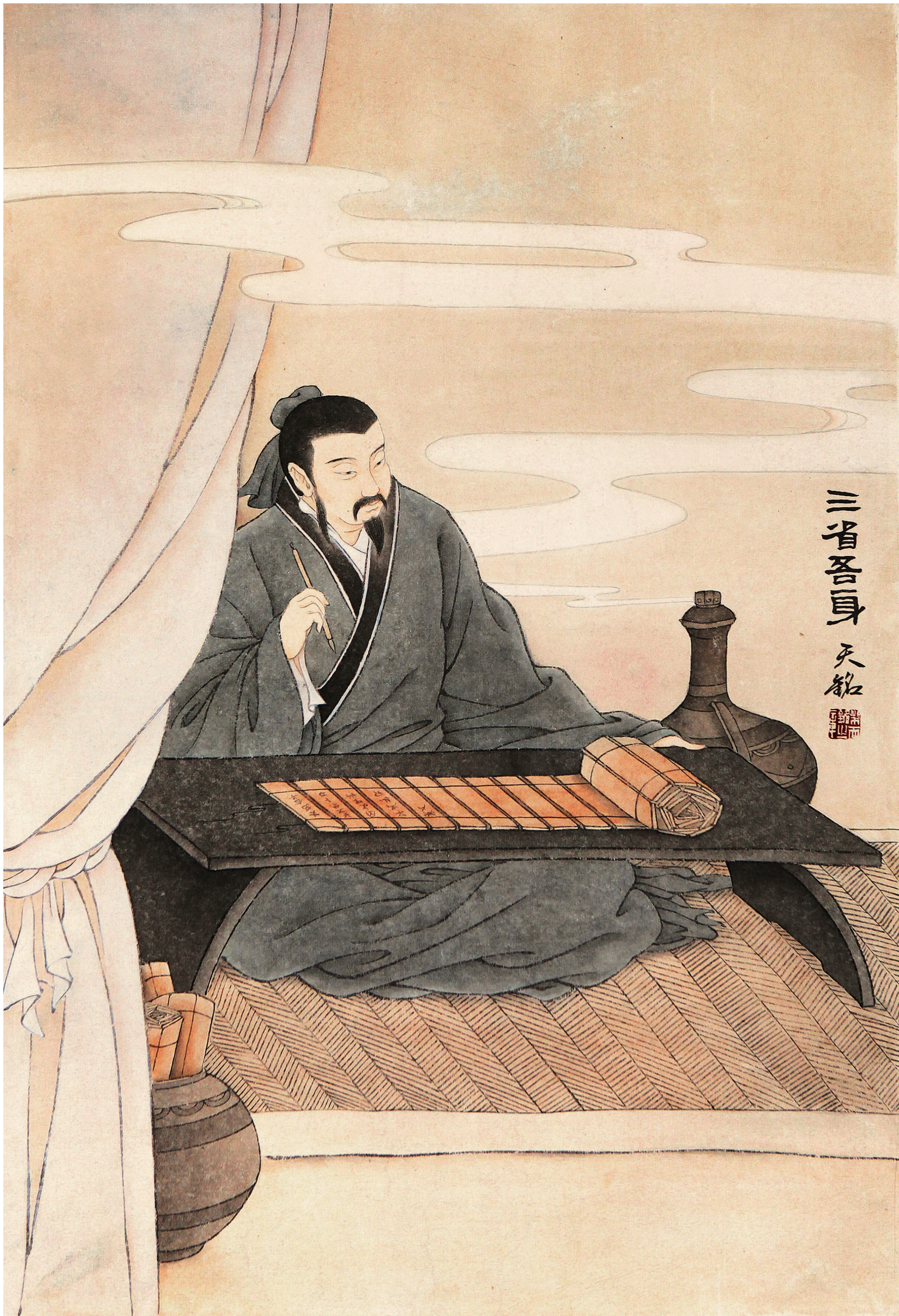
《三省吾身》 梁天铭 作