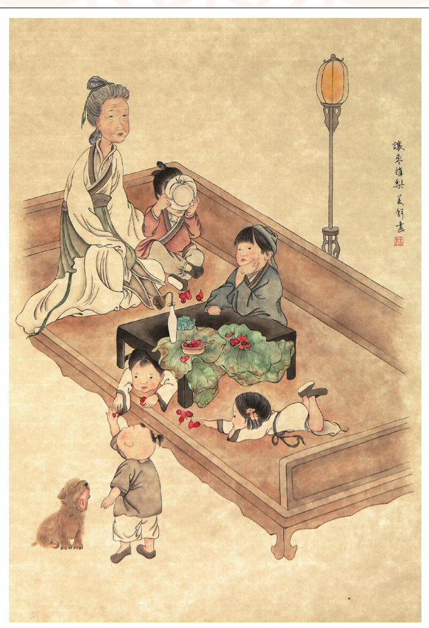
《让枣推梨》 林美舒 作