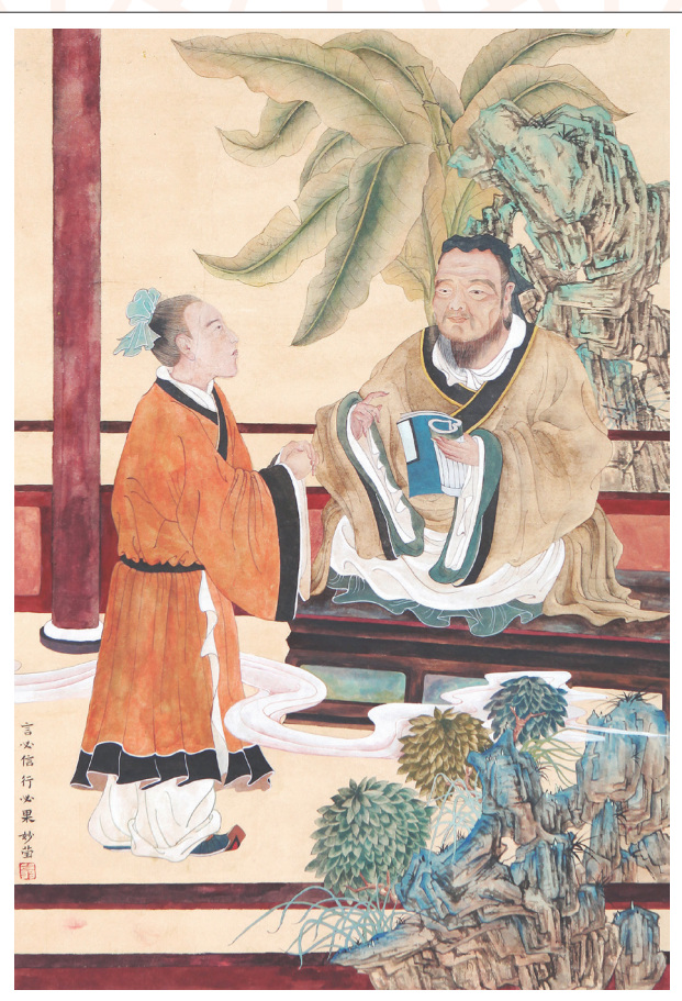
《言必信 行必果》 翁妙莹 作